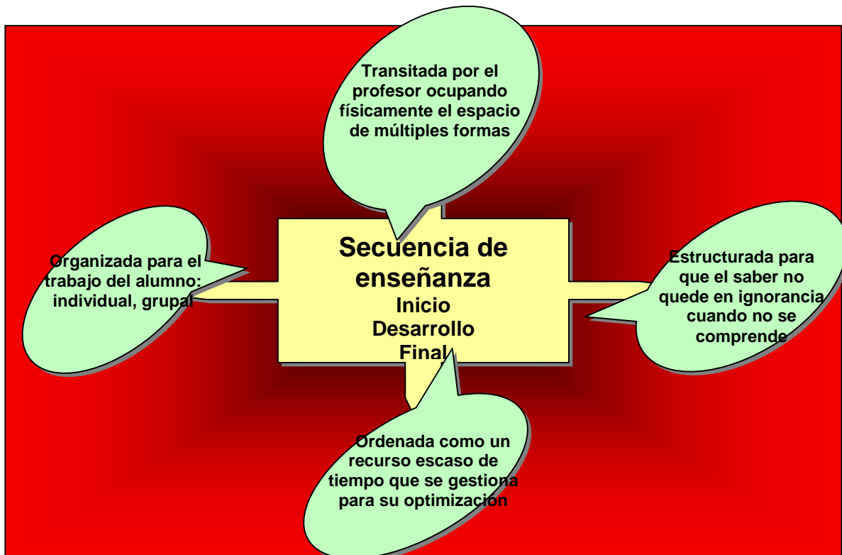
CUADRO 1 Características de la secuencia de enseñanza

Sobre los estudios más significativos realizados sobre la enseñanza de la historia, cabe subrayar la revisión llevada a cabo por Wilson (2001). En ella, después de señalar la desigualdad de las diferentes investigaciones, Wilson indica que en su mayoría están dirigidas hacia prácticas ejemplares y descripciones de modelos no probados de enseñanza, siendo escasas las que recogen cómo esos métodos ejemplares son aprendidos por los alumnos en contextos concretos. Hay, como señala Wilson, excepciones con respecto a las apreciaciones expuestas anteriormente. Así, en su estudio se percibe un mayor compromiso por parte de los investigadores a progresar en cuanto al poder aclaratorio de las explicaciones, pero no tenemos teorías que aclaren los mecanismos por los cuales cierto tipo de enseñanzas lleva al aprendizaje significativo de los estudiantes o cómo algunas creencias influyen en el aprendizaje. Posiblemente se trata de nuestro reto futuro y estaría referido a los factores a tener en cuenta para posteriores esfuerzos investigadores, entre los que destacan los siguientes: revisar el concepto de buena enseñanza, atender a las conexiones entre enseñanza y aprendizaje, así como los usos de los medios y la clarificación estratégica de las investigaciones realizadas por las distintas comunidades científicas.