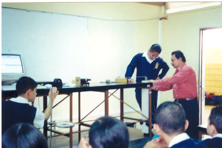
FIGURA 2 Aula EFIT. Escuela Secundaria Técnica n.º 24, Mérida, Yucatán