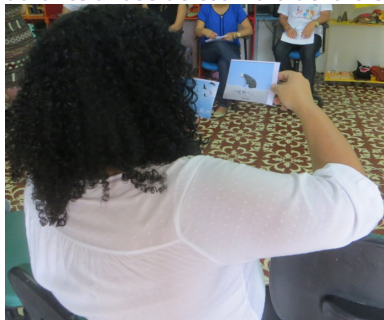
Ilustración de la dinámica freireana de la "palabra generadora" durante a fase de estímulo de la creatividad