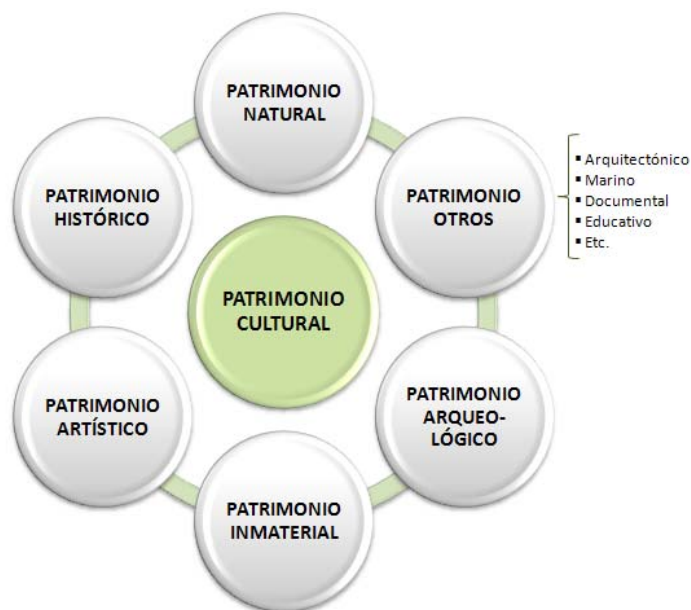
CUADRO 3 Esquema sobre el concepto de Patrimonio