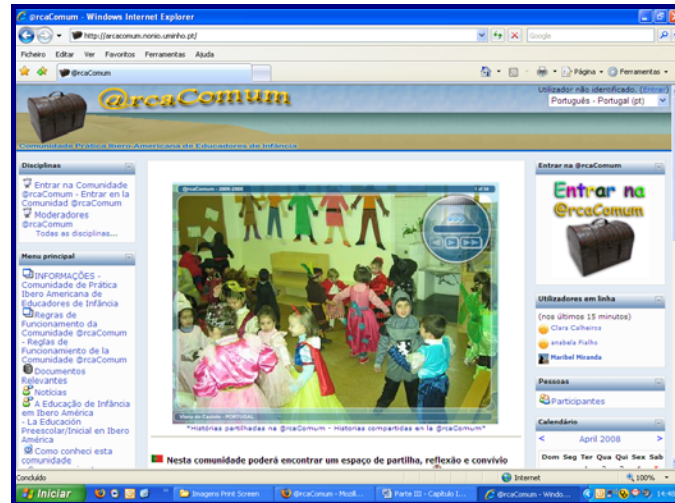
FIGURA 1 Aspecto Gráfico da @rcaComum – Mayo 2008

La idea base de este proyecto pasa por la integración de las TIC en la educación de infancia a través de la participación de los educadores en esta Comunidad. El aspecto gráfico inicial de la comunidad @rcaComum fue pensado como acogedor, y de fácil integración, siendo que tuvimos la preocupación de que los contenidos y estructura de la comunidad estuvieran en español y portugués. La participación de cada profesional que integra la comunidad es en su lengua materna, como forma de valorizar su cultura y enriquecer los intercambios.