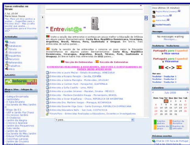
FIGURA 6 Área de Entrevista

Las entrevistas realizadas a diversos participantes de la comunidad, de varios países iberoamericanos, fueron publicadas con autorización de los entrevistados en la comunidad @rcaComum. Esta dinámica estaba prevista como actividad mensual y en el recorrido de un año y medio tuvimos la oportunidad de entrevistar a trece profesionales de educación de infancia.