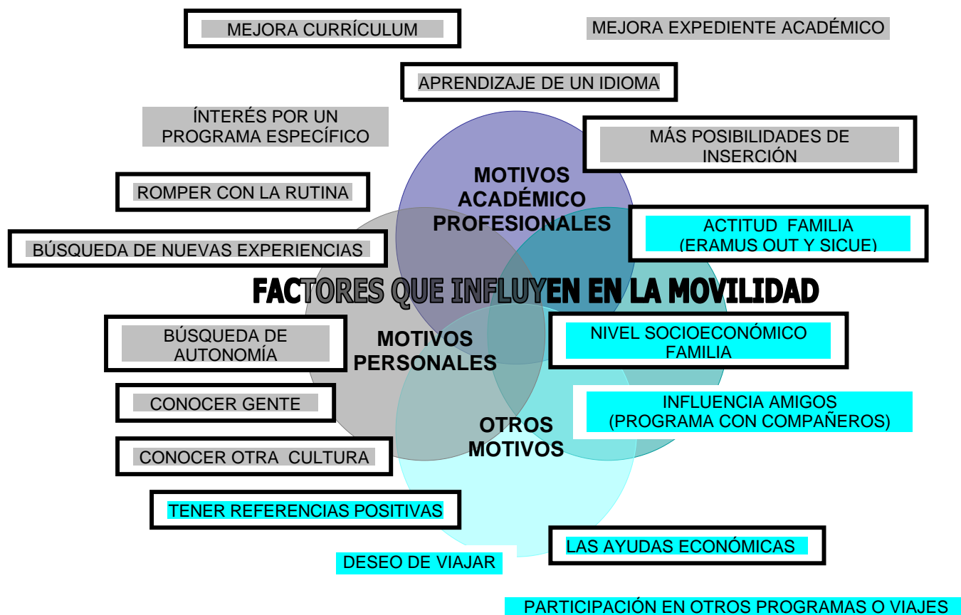
FIGURA 3 Mapa conceptual: principales factores que influyen en la movilidad 11

A partir de las principales conclusiones, presentamos a continuación una serie de propuestas 12 que pretenden mejorar la movilidad y estimularla. Organizamos las propuestas según los organismos a quien van dirigidas: a las Universidades —facultades y órganos de gestión institucional—, a la Administración Pública —MEC y organismo correspondiente en las CCAA— y a la Unión Europea.