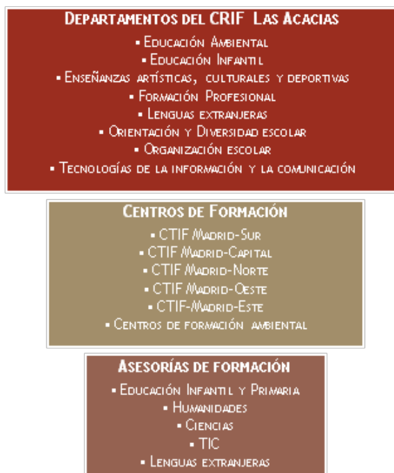
FIGURA 1 Red de formación permanente para el profesorado

El centro regional está organizado en departamentos, que se encargan del seguimiento y evaluación de las actividades de formación que realizan, mientras que los centros territoriales cuentan con asesorías de formación. El área de Tecnologías de la Información y Comunicación cuenta con un departamento en el CRIF Las Acacias, que es el responsable de las actividades de formación en línea que se realizan desde la red, y 12 asesores repartidos en los cinco centros territoriales.