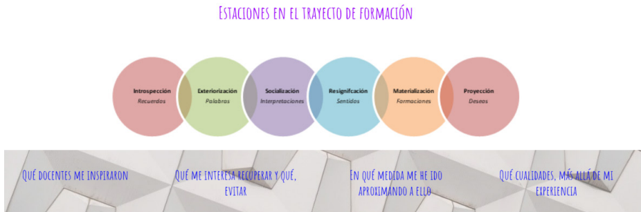
Figura 7. Estaciones en el trayecto de formación

Se prevé presentar este dispositivo en la próxima reunión general de docentes del Campo de la PPD, a inicios del ciclo lectivo, para analizar posibles mejoras y empezar a proveer contenido. Se espera poder presentarlo completo hacia fines del año académico, tanto a la comunidad del PM como de otros Profesorados Universitarios en Matemática de Argentina, a través de las III Jornadas de Práctica Profesional Docente en Profesorados Universitarios en Matemática ( https://sites.google.com/view/jppdpum/ ).