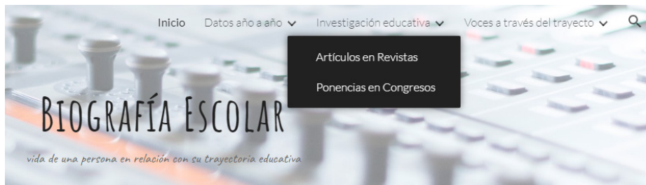
Figura 5. Desglose de los tipos de materiales de investigación educativa

A través de la pestaña “Investigación educativa” (Figura 5) se accede a “Artículos en Revistas” y “Ponencias en Congresos” que, sobre la temática, específicamente con relación a las/os docentes memorables, se viene haciendo desde el equipo de investigación. La intención es referenciar allí los trabajos con su respectiva información bibliométrica y acceso.