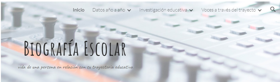
Figura 3. Inicio del sitio

Como encabezado (Figura 3), se dispone el título de “Biografía Escolar” con un breve subtítulo que resume “vida de una persona en relación con su trayectoria educativa”. Además, en la parte superior derecha se incluyen tres solapas, que abarcan los asuntos básicos que se consideran, al menos en un principio, para sistematizar a nivel comunidad en el PM: Datos año a año; Investigación educativa; Voces a través del trayecto.