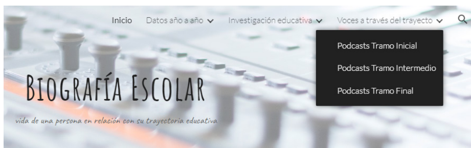
Figura 6. Desglose de podcasts con voces de los protagonistas por tramo de formación

En cuanto a las/os protagonistas, en “Voces a través del trayecto” (Figura 6) se procura recuperar registros en podcasts, o análogos, que den cuenta de al menos tres tramos de formación: inicial, intermedio y final. Está previsto hacerlo mediante audios breves con reflexiones puntuales a las que las/os estudiantes lleguen al momento de cierre de los trabajos dedicados al tema en cada PPD (I tramo inicial; II y III tramo intermedio; IV tramo final).