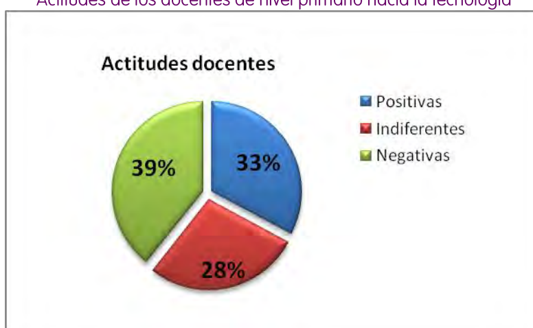
Figura 1 Actitudes de los docentes de nivel primario hacia la tecnología

Tal como se observa en la Figura 1, la mayoría de los docentes tiene una actitud negativa hacia la tecnología. Dentro de este grupo, al analizar los distintos ítems que componen las escalas, observamos que el 26.2% de los docentes no se lleva bien con las computadoras, el 19.7% no entiende los resultados que éstas arrojan y el 11.5% las evade porque para ellos son un misterio. El 13.2% teme dañarla al usarla mientras que al 18.1% le atemoriza destruir una gran cantidad de información por presionar la tecla incorrecta. Un 18% afirma que al interactuar con equipos informáticos se siente muy tenso, un 24.6% inseguro, un 13.1% intranquilo y un 11.5% incómodo. Para el 14.8% de la muestra es mejor hacer las cosas a mano que con computadoras y el 21.3% las utiliza solo si se lo exigen en el trabajo y/o estudio. El 80.3% afirma que en nuestro país no contamos con los equipos informáticos tanto como deberíamos y el 40.9% dice que puede usarlos pero siempre sin demasiada expectativa. Para el 13.1% las computadoras interfieren en las relaciones profesionales y docentes.