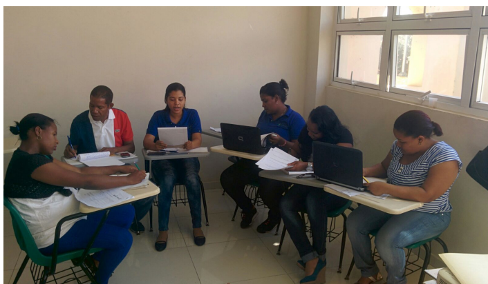
Evidencia fotográfica de grupo de docentes principiantes reunidos en un círculo de aprendizaje diseñando su planificación curricular bajo la supervisión y acompañamiento de su mentor.

Las actividades que han desarrollado son: demostraciones de prácticas docentes, análisis de grabaciones de videos, planificaciones curriculares, invitación a especialistas y reuniones-taller a través de la plataforma del Programa.