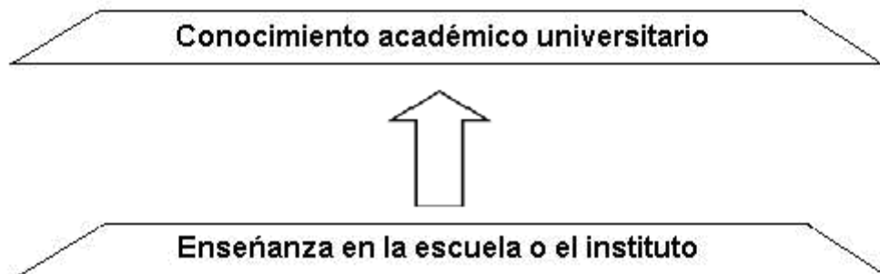
IMAGEN 2. Construcción del conocimiento desde el modelo hermenéutico-interpretativo. Adaptado de Rozada (2007: 34).

Podemos concluir señalando que necesitamos una nueva concepción que supere las limitaciones de los dos modelos comentados